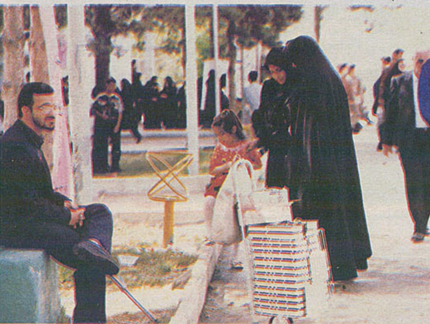
روز هفتم با سینما

نمایشگاهی از آثار هنرجویان نگارخانه نصر در نگارخانه وصال شیراز برپا شده است. در این نمایشگاه تعداد ۹۶ اثر در زمینه‌های خط‌ریز نستعلیق، تحریری و نستعلیق درشت از ۴۵ هنرجو در معرض دید عموم قرار گرفته است.